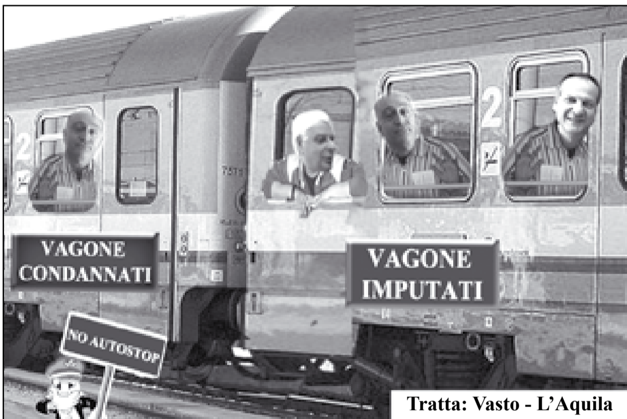
Tratta: Vasto - L'Aquila

Parte da Vasto la risposta unitaria del centro-destra sugli indagati nelle liste dopo che la questione morale ha travolto la Regione